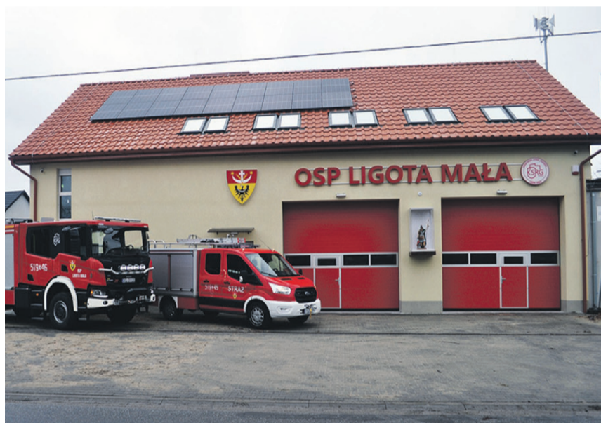
Strażacy ochotnicy mają godne warunki do swojej działalności i dwa nowe pojazdy