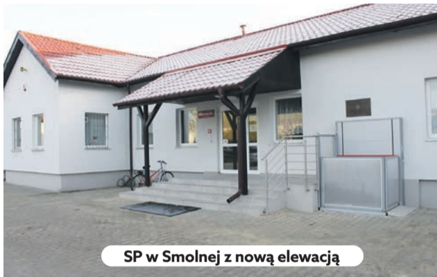
SP w Smolnej z nową elewacją