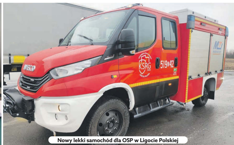
Nowy lekki samochód dla OSP w Ligocie Polskiej