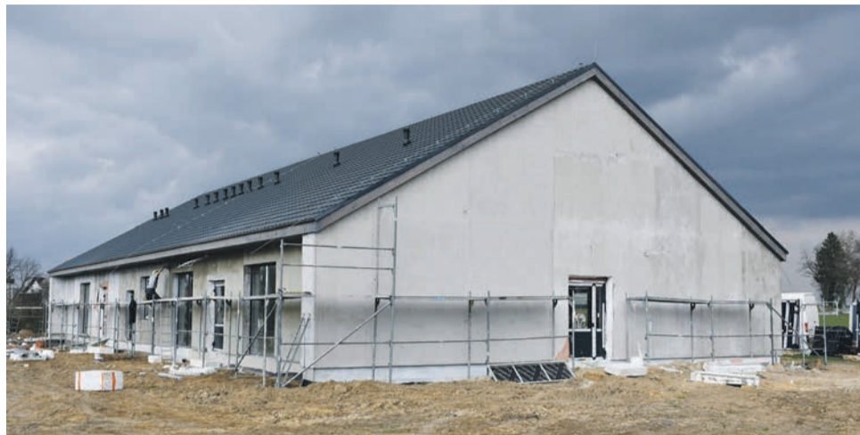
Budowa w Boguszytach