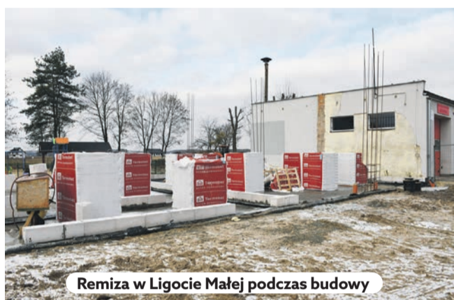
Remiza w Ligocie Małej podczas budowy