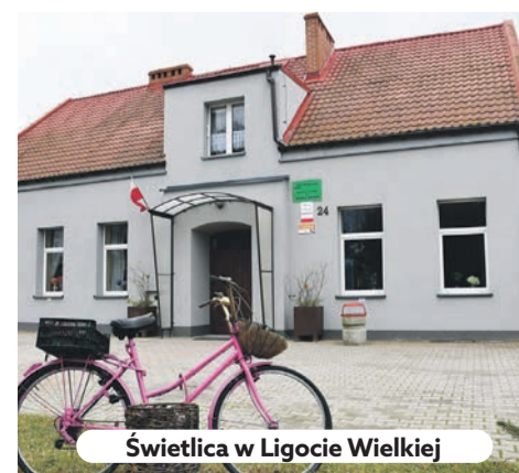
Świetlica w Ligocie Wielkiej