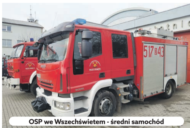
OSP we Wszehświecie - średni samochód