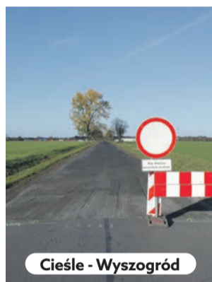
Cieśle - Wyszogród