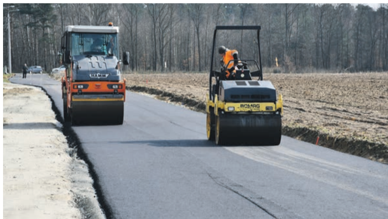
Przebudowa i rozbudowa drogi gminnej w miejscowości Sokołowice