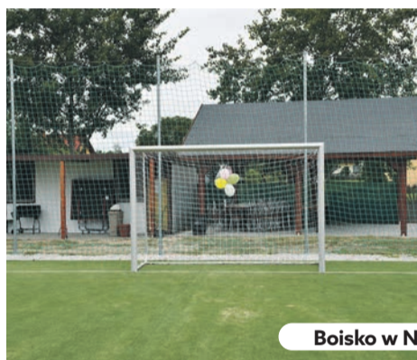
Boisko w Nieciszowie