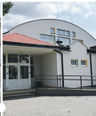
Rozbudowa SP w Ligocie Polskiej