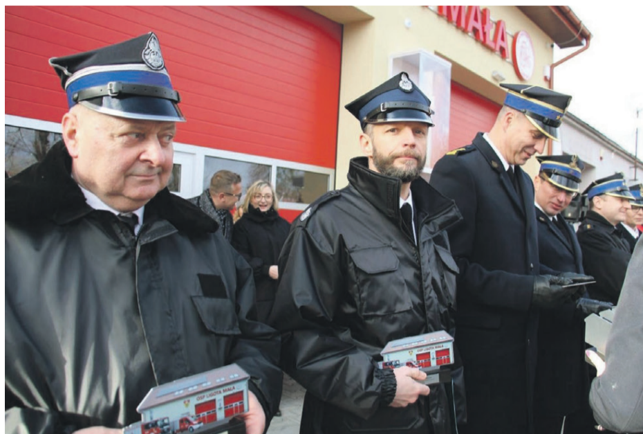
Na ręce zaproszonych gości trafiły metalowe miniaturki remizy