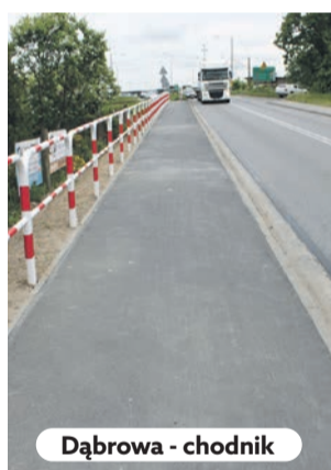
Dąbrowa - chodnik