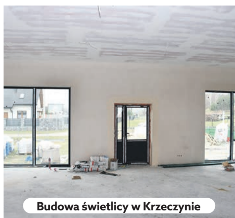
Budowa świetlicy w Krzeczynie