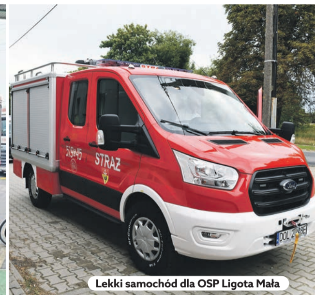
Lekki samochód dla OSP Ligota Mała