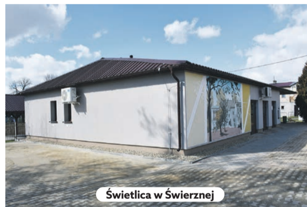
Świetlica w Świerznej