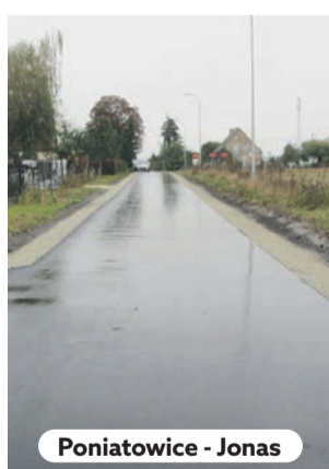
Poniatowice - Jonas