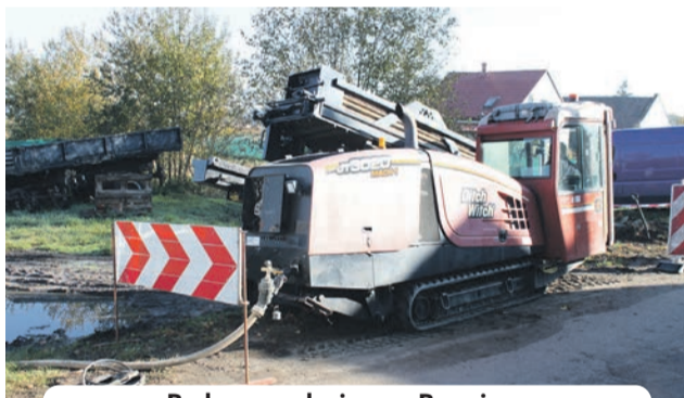
Budowa wodociągu w Brzezince