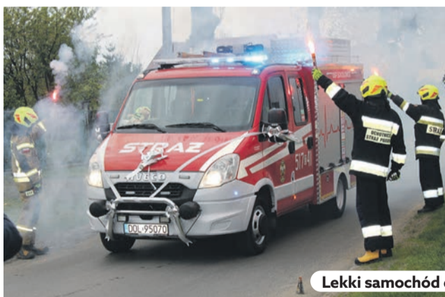
Lekki samochód dla OSP Sokołowice