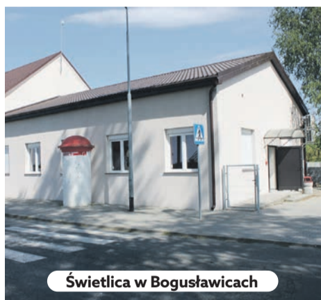
Świetlica w Bogusławicach