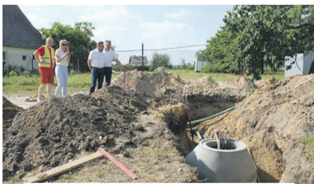
Budowa kanalizacji w Ligocie Wielkiej