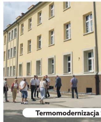
Termomodernizacja SP Gminy Oleśnica