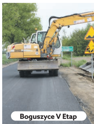
Boguszyce V Etap