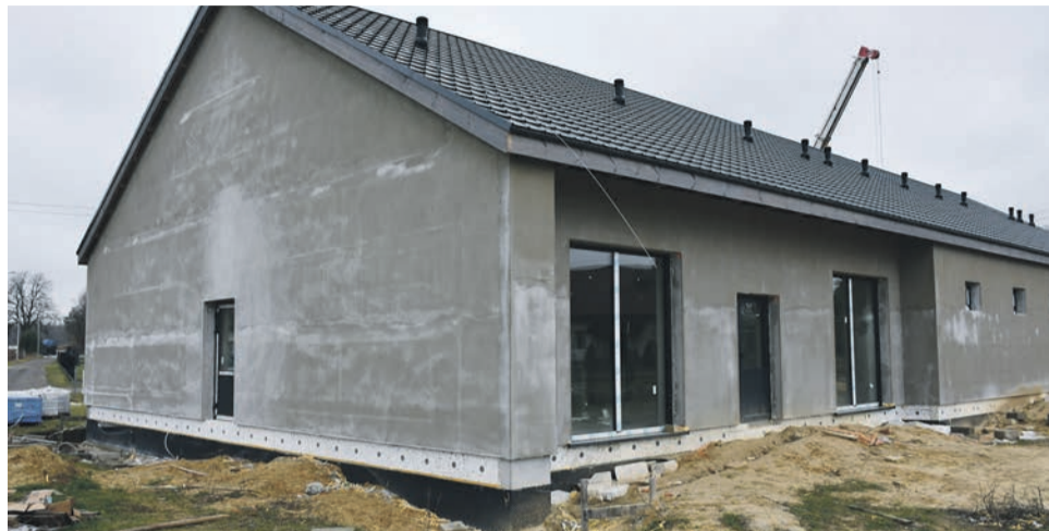
Budowa w Krzeczynie