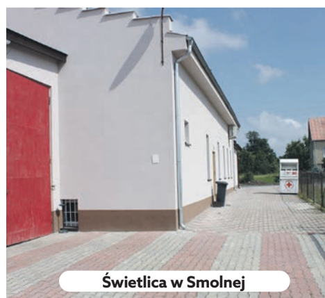
Świetlica w Smolnej