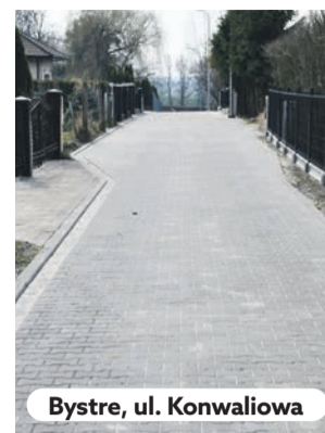
Bystre, ul. Konwaliowa