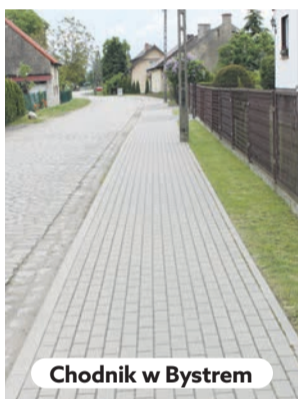
Chodnik w Bystrem