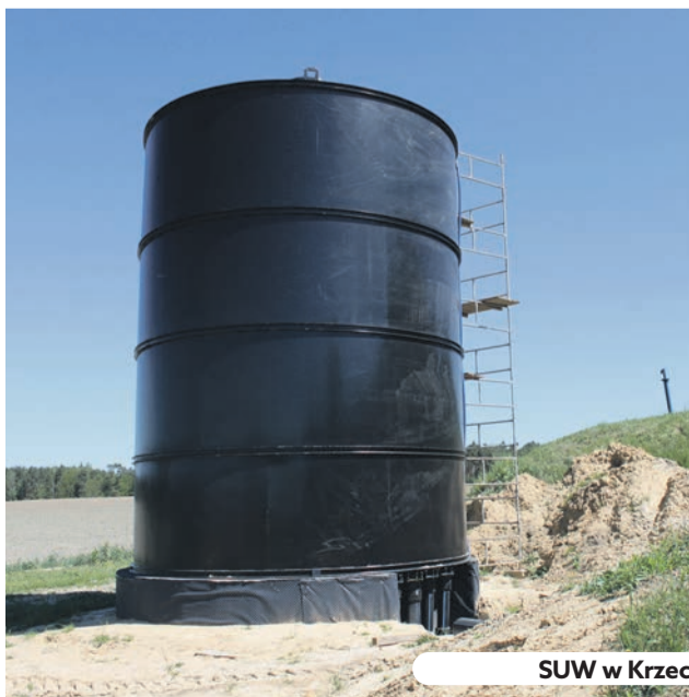
SUW w Krzeczynie po remoncie