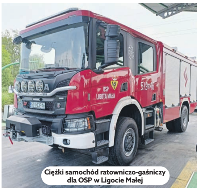
Ciężki samochód ratowniczo-gaśniczy dla OSP w Ligocie Małej