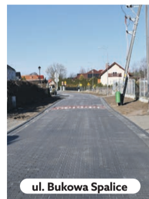
ul. Bukowa Spalice