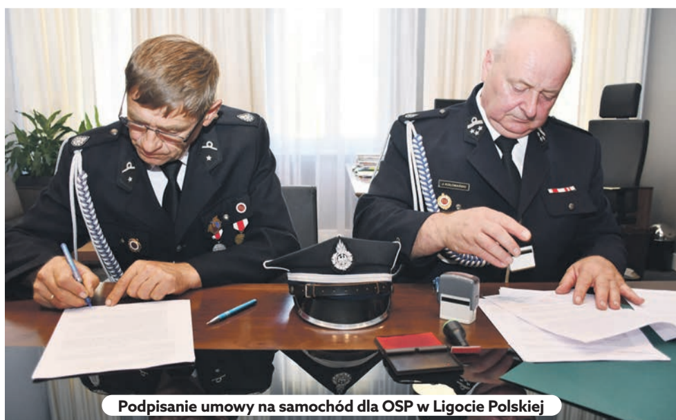
Podpisanie umowy na samochód dla OSP w Ligocie Polskiej