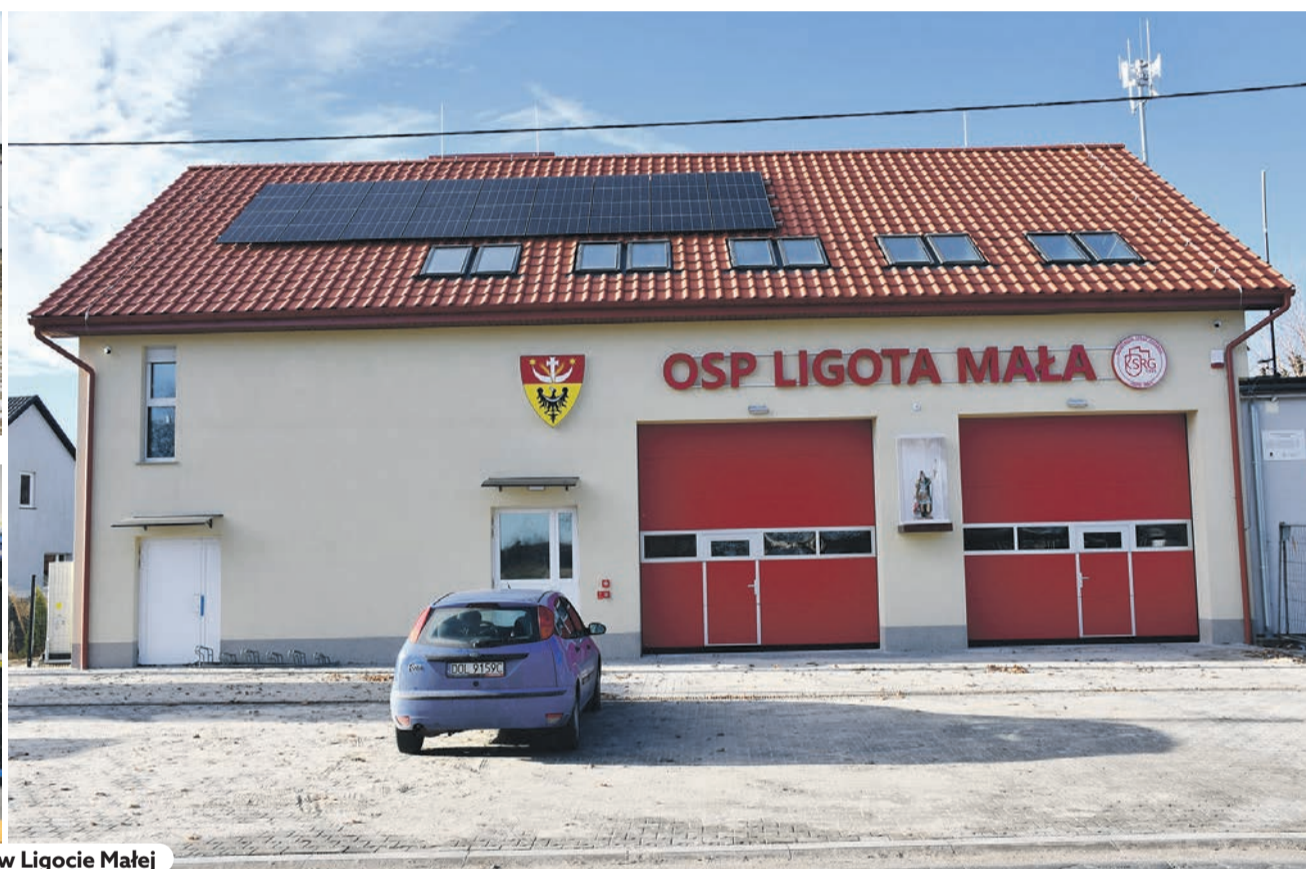
Nowa remiza w Ligocie Małej