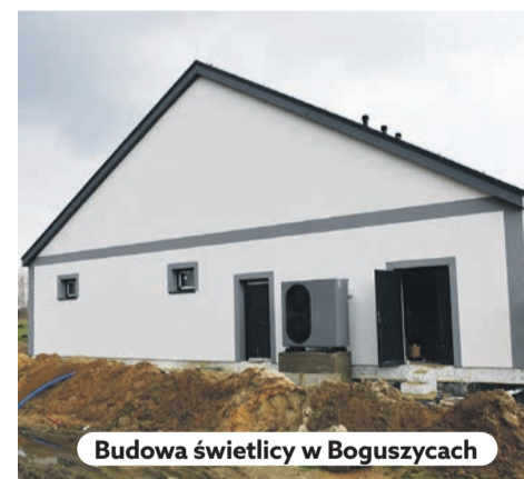
Budowa świetlicy w Boguszycach