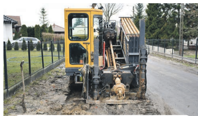
Budowa kanalizacji w Smolnej