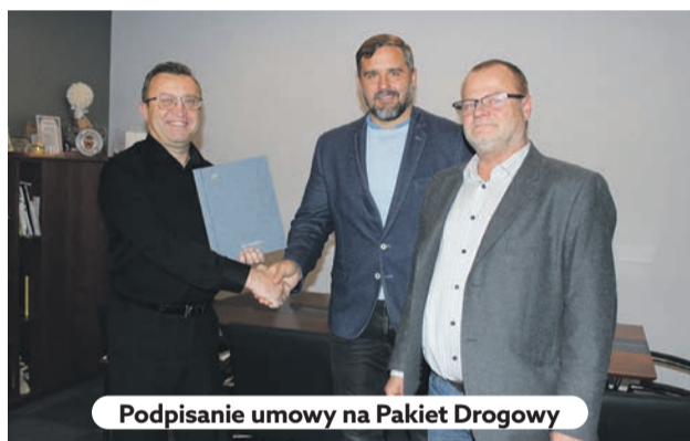
Podpisanie umowy na Pakiet Drogowy