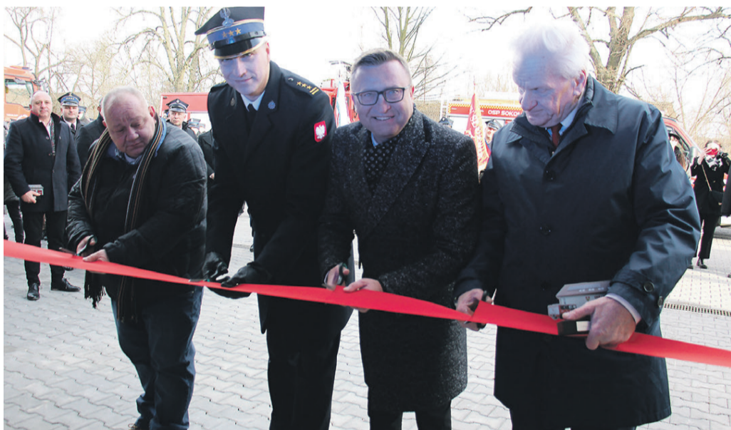
Panowie, przecinamy i zapraszamy do środka!

Pięć jednostek Ochotniczych Straży Pożarnych w Gminie Oleśnica to jedna z najważniejszych organizacji pozarządowych. Strażacy ochotnicy dbają o bezpieczeństwo mieszkańców, nie tylko gminy Oleśnica, ale również miasta Oleśnica i innych ościennych gmin. Remizy OSP oprócz swojej podstawowej funkcji są też centrami życia społecznego we wsiach. Samorząd gminy docenia te działania, wspiera je, inwestuje w bazę i sprzęt.