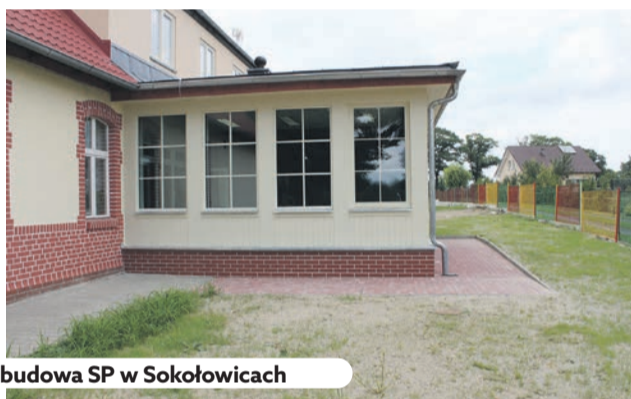
Rozbudowa SP w Sokołowicach