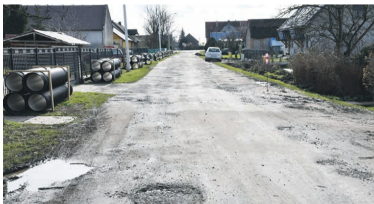
Przebudowa drogi wraz z wykonaniem odwodnienia w miejscowości Smardzów