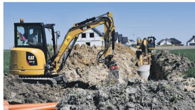
Budowa kanalizacji w Smardzowie