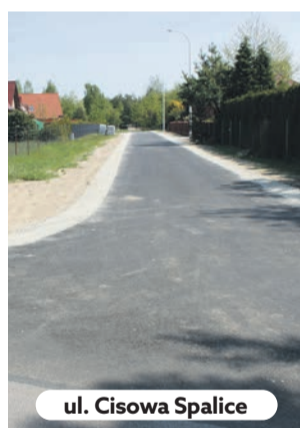
ul. Cisowa Spalice