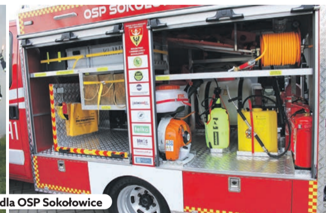
Lekki samochód dla OSP Sokołowice