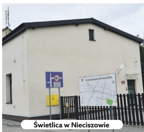
Świetlica w Nieciszowie