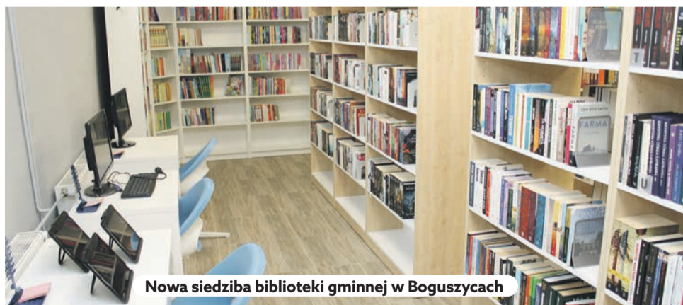
Nowa siedziba biblioteki gminnej w Boguszycach